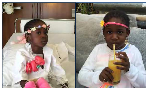
Nana de l'opération à la guérison

En mai, elle est allée retrouver sa famille et sa maison au milieu du désert.