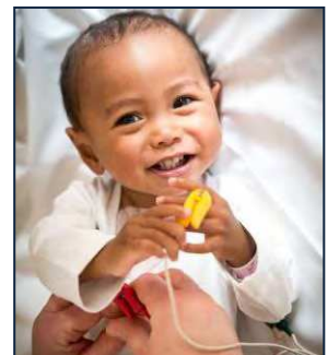
Nato, petit rayon de soleil