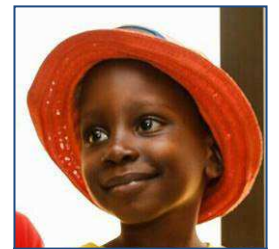
... après ?

Tu resteras toujours dans nos cœurs. Nous te souhaitons une longue vie de bonheur"... »