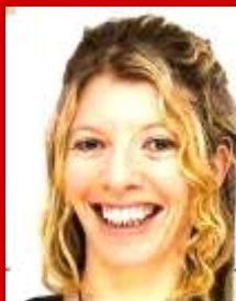
Formatrice d'animateurs DIH