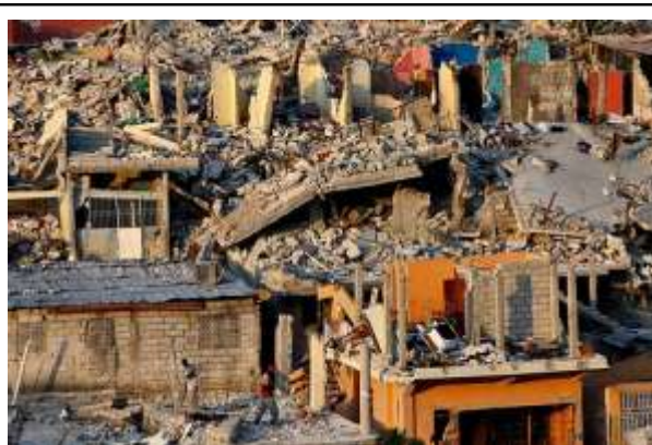
Des habitations en ruine après le séisme qui a frappé Port-au-Prince, en Haïti, le 12 janvier 2010.

Les événements d'Haïti auront permis une mobilisation exemplaire de la population. Profitons-en pour rappeler l'existence de millions de personnes vulnérables dans le monde qui ont besoin de notre aide. Maintenant.