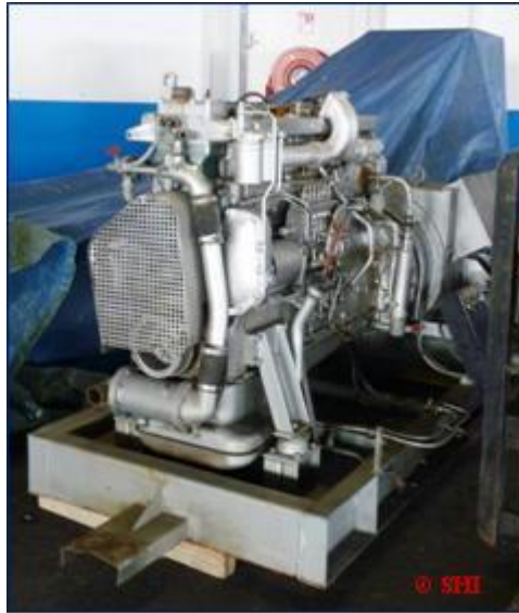
Le second groupe électrogène à son arrivée au local de Fontvieille.

Description du projet : Réforme et réparation d'un groupe électrogène de 350 KVA par des bénévoles, enseignants et lycéens du Lycée Technique de Monaco, pour une seconde vie dans un établissement de santé en Afrique.